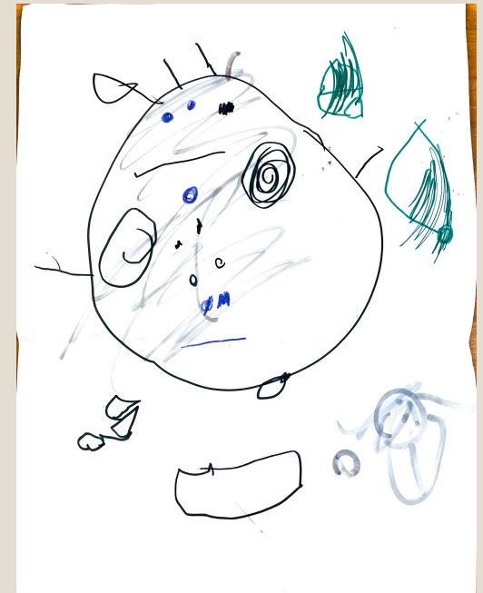
Ritratto di E., (sezione medi) Grafica di L (sezione grandi)., 2 anni e 10 mesi

Il nido Amendola porta avanti e si rende promotore dell'intersezione tra le varie e diverse sezioni in esso presenti per fare in modo che tutti i bambini possano conoscersi tra loro, incontrare altre educatrici e condividere spazi, tempi e proposte educative.